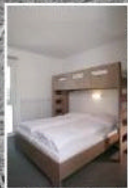
Trippelzimmer Doppelzimmer mit Zusatzbett